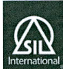
Summer Institute of Linguistics