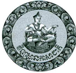
Institute of National Language