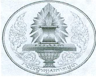
Royal Academy of Cambodia